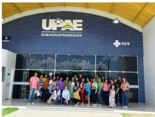
Reunião com coordenações da atenção básica e reguladores da III GERES.

Ressaltamos que além do cunho educativo de apresentação do funcionamento da UPAE realizado com as coordenações da atenção básica dos municípios, fizemos reuniões para alinhamento dos agendamentos das consultas e captação de mais demanda para a Unidade.